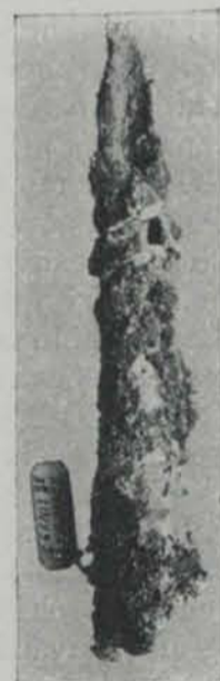
Fig. 83 Objecte d'os del sepulcre de Sant Genís de Vilassar (1/2 apr.)

L'esquelet oferia una lleugera inclinació que podia apreciar-se en la columna vertebral: el cap i les espatlles estaven en el pla més elevat. Prop del braç esquerre aparegué una pedra calissa irregular col·locada en el pla del sepulcre. A l'altra banda, guardant també paral·lelisme amb l'esquelet, fou trobat un ganivet de sílex (llarg 6'4 centímetres) pla a