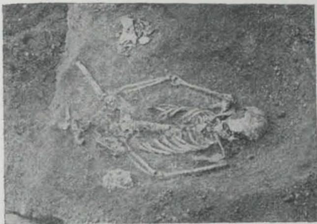
Fig. 82. — Sepulcre de Sant Genís de Vilassar

En 1917 l'INSTITUT pogué excavar un nou sepulcre que aparegué en el lloc de la necròpolis de Vilassar. Era, com els anteriors que excavà el Sr. Folch i Torres (1), un sepulcre d'inhumació