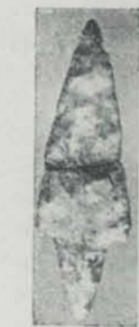
Fig. 79. Baix Aragó (?) Punta de sageta de sílex

L'altre fenomen típic d'aquesta cultura del Baix Aragó és la ceràmica polida sense decoració.