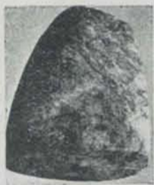
Fig. 81. — Miravet. Destrals de fibrolita (2/3 apr.)

En primer lloc, les moles o sia turons alts, amb un petit planell al cim, en el qual es troba una estació que se sol anomenar neolítica per la